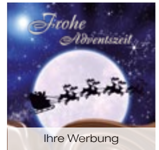
4 Mini Schokolade