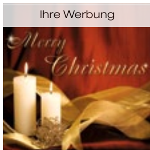
9 Mini Kerzen