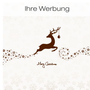
10 Mini Reh