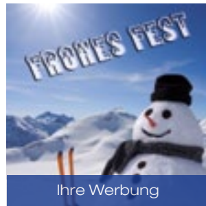
2 Mini Schneemann