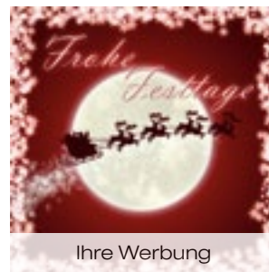
11 Mini Schlitten