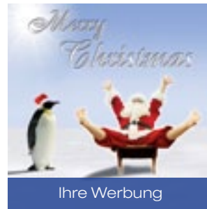
3 Mini Santa