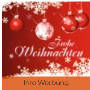
5 Mini Kugeln hängend