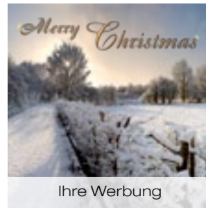
7 Mini Schneelandschaft