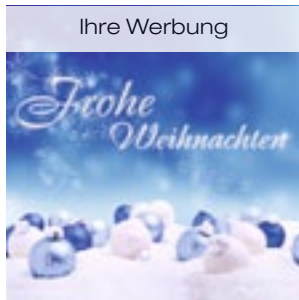
1 Mini Kugeln liegend