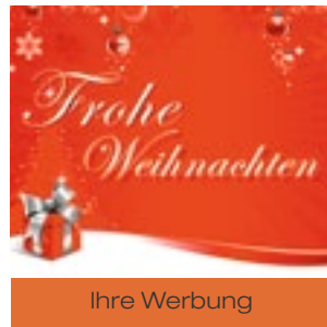
6 Mini Geschenk